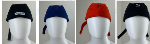
Art. 23-3611 23-3612 23-3613 23-3615