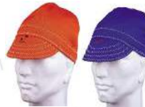
Art. 23-*514 23-*515